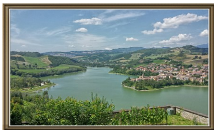
DIGA\LAGO DI MERCATALE (PU)

Un sincero ringraziamento per la fattiva collaborazione al Comune di Castrocaro Terme e Terra del Sole, alla Pro Loco di Terra del Sole e al Comitato Genitori della scuola.