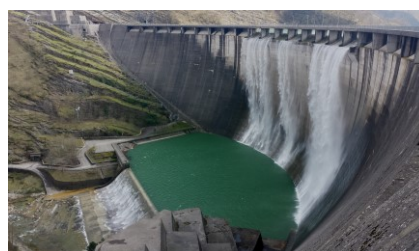
DIGA\LAGO DI RIDRACOLI (FC)