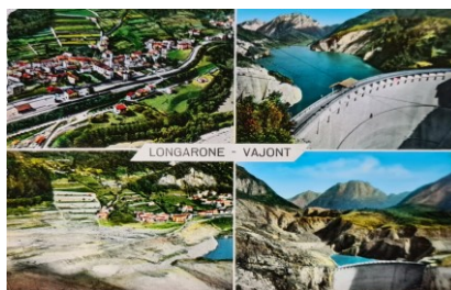
LONGARONE E IL VAJONT (BL)